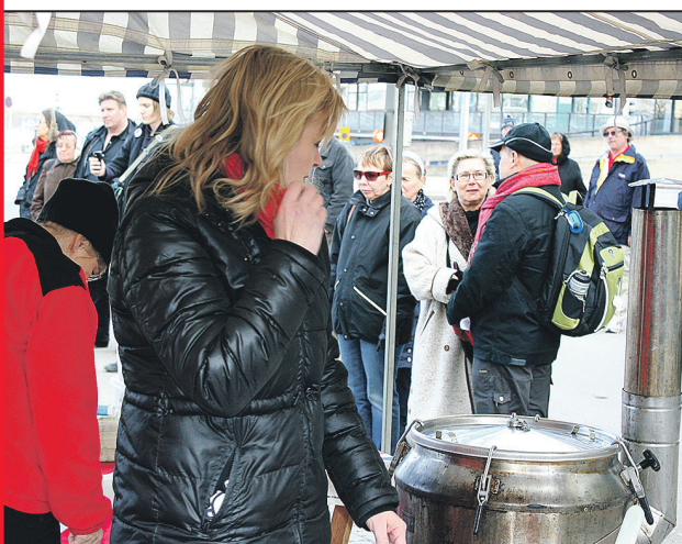
Torilla on puheiden lisäksi tarjolla keittoa

Metalli Vitonen on yksi tapahtuman järjestäjistä Kuvat Mikki-auki tapahtumasta 2014