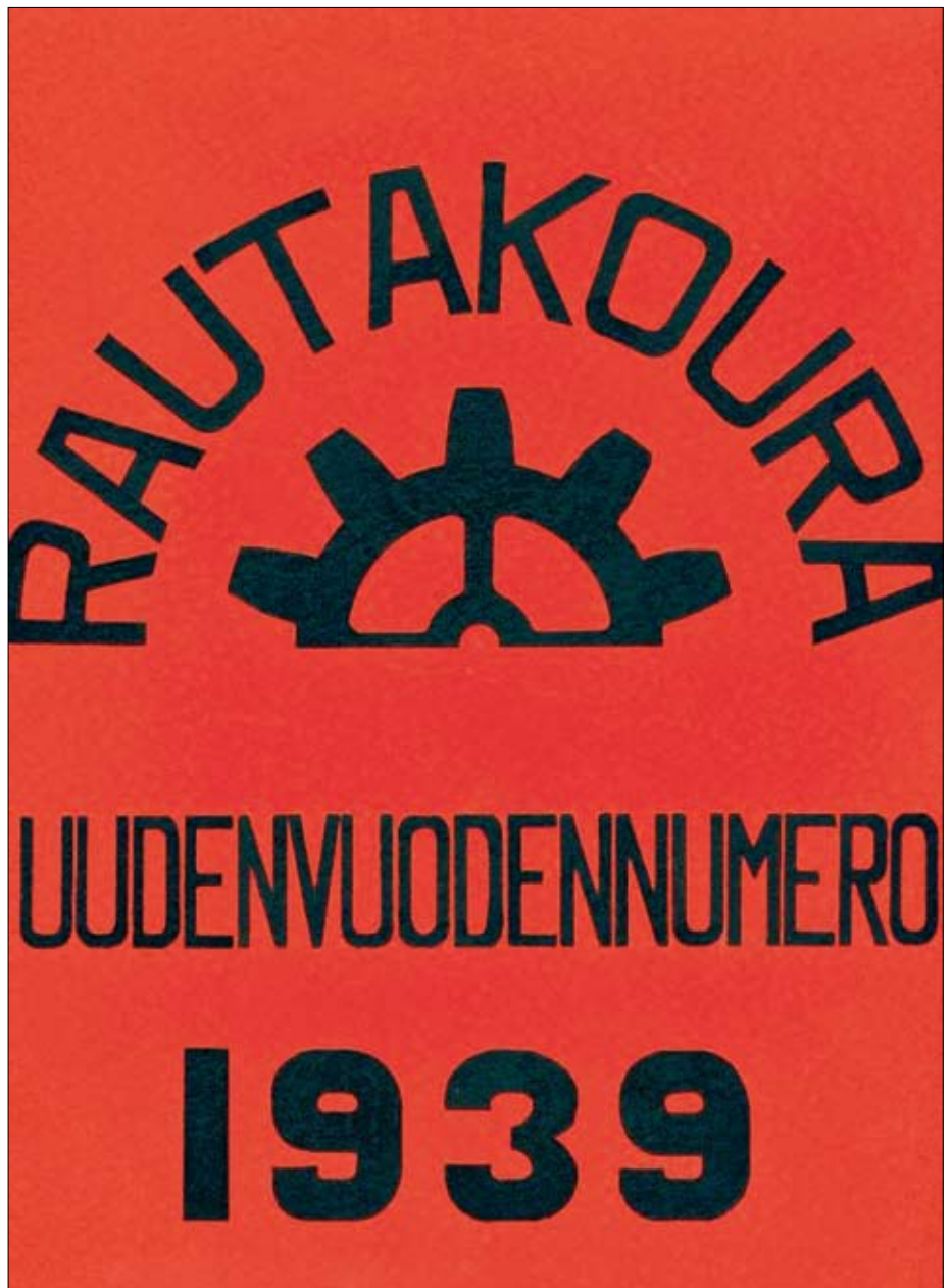
Ammattiosaston käsinkirjoitetun lehden kansi lähes 70 vuoden takaa