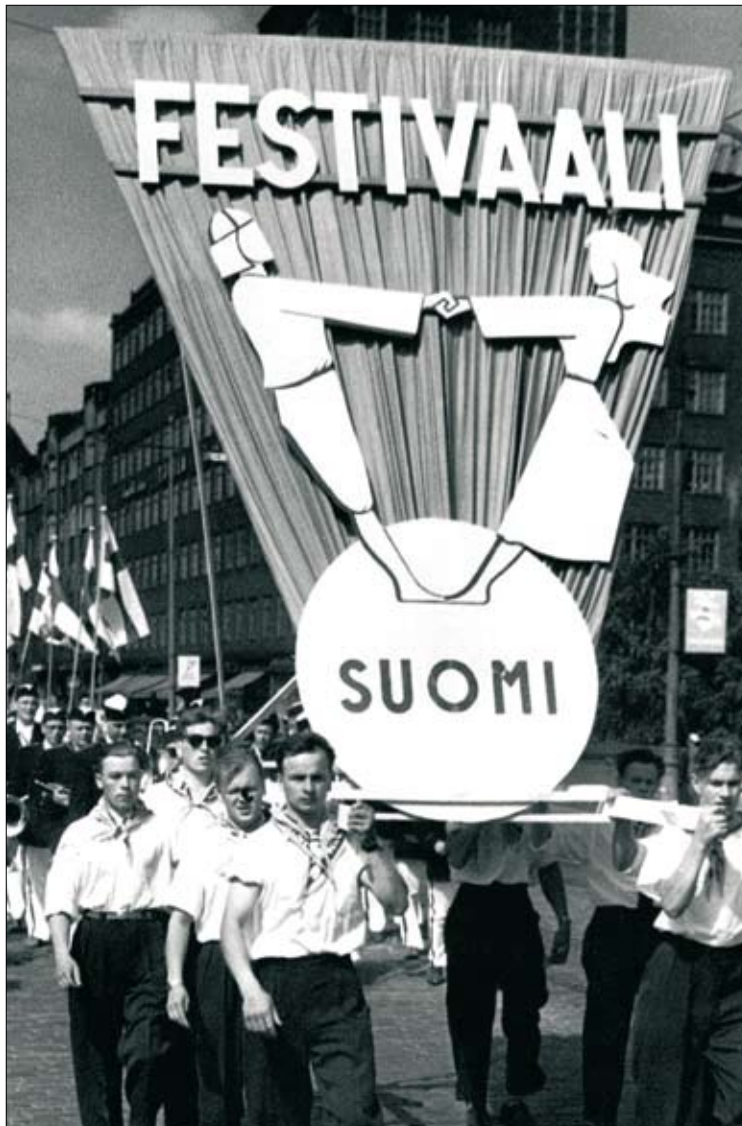
Helsingin nuorisofestivaalit 1961