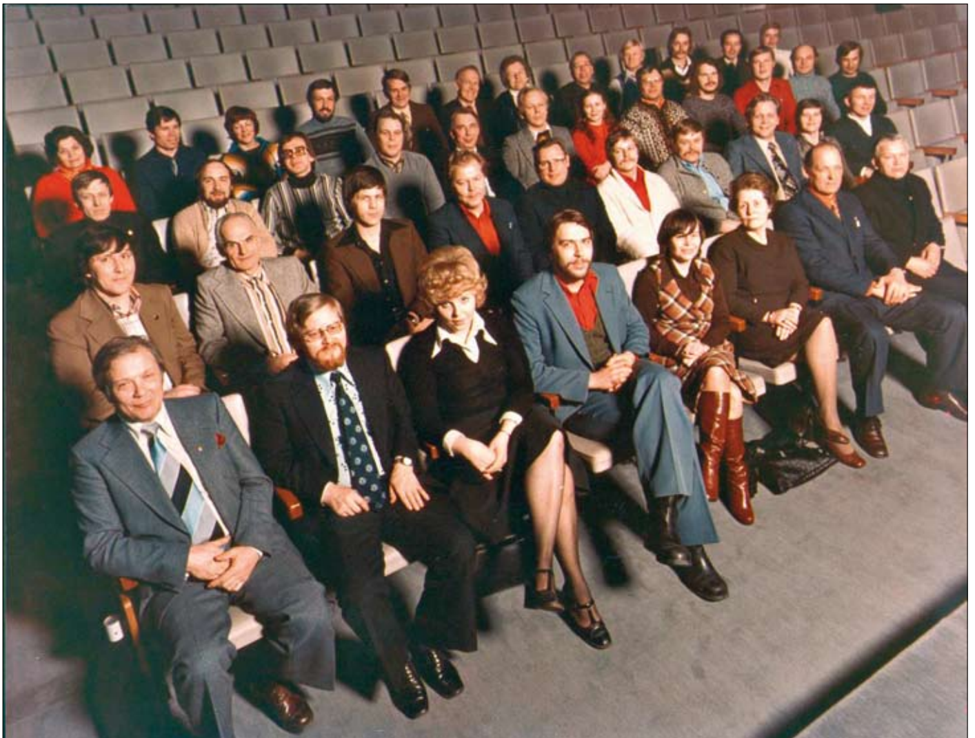
Ammattiosaston vuosien 1976 ja -77 toimikunnat yhteiskuvassa