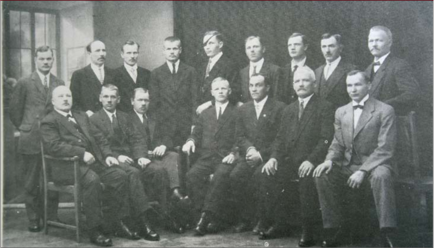
Helsingin Metallityöntekijäin Teollisuusneuvosto vuodelta 1921

toinen, sillä historian tapahtumista löytyy selkeitä yhteneväisyyksiä myös nykyaikaan. Esimerkkeinä monet globalisaatiokehityksen seurauksena tapahtuneet, varsinkin teollisten tuotantolaitosten lopettamiset Euroopassa, mutta myös USA:ssa, ja niiden siirtyessä yksipuolisen ja monien mielestä, lyhytnäköisen omistajapolitiikan seurauksena ns. halpojen tuotantokustannusten maihin. On monin puheenvuoroin herätty puhumaan protektionismin uudelleen esille nostamisesta. Suomessa esimerkiksi voidaan tähän asiayhteyteen nostaa Kemijärven sellutehdas.