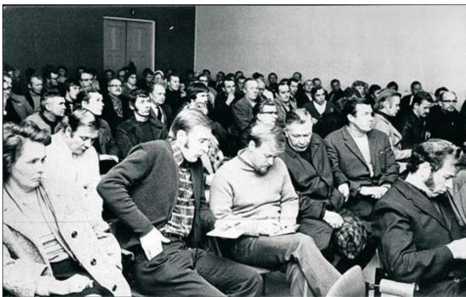
Kuva vuodelta 1972 työehtosopimusvaatimusten valmistelukokous