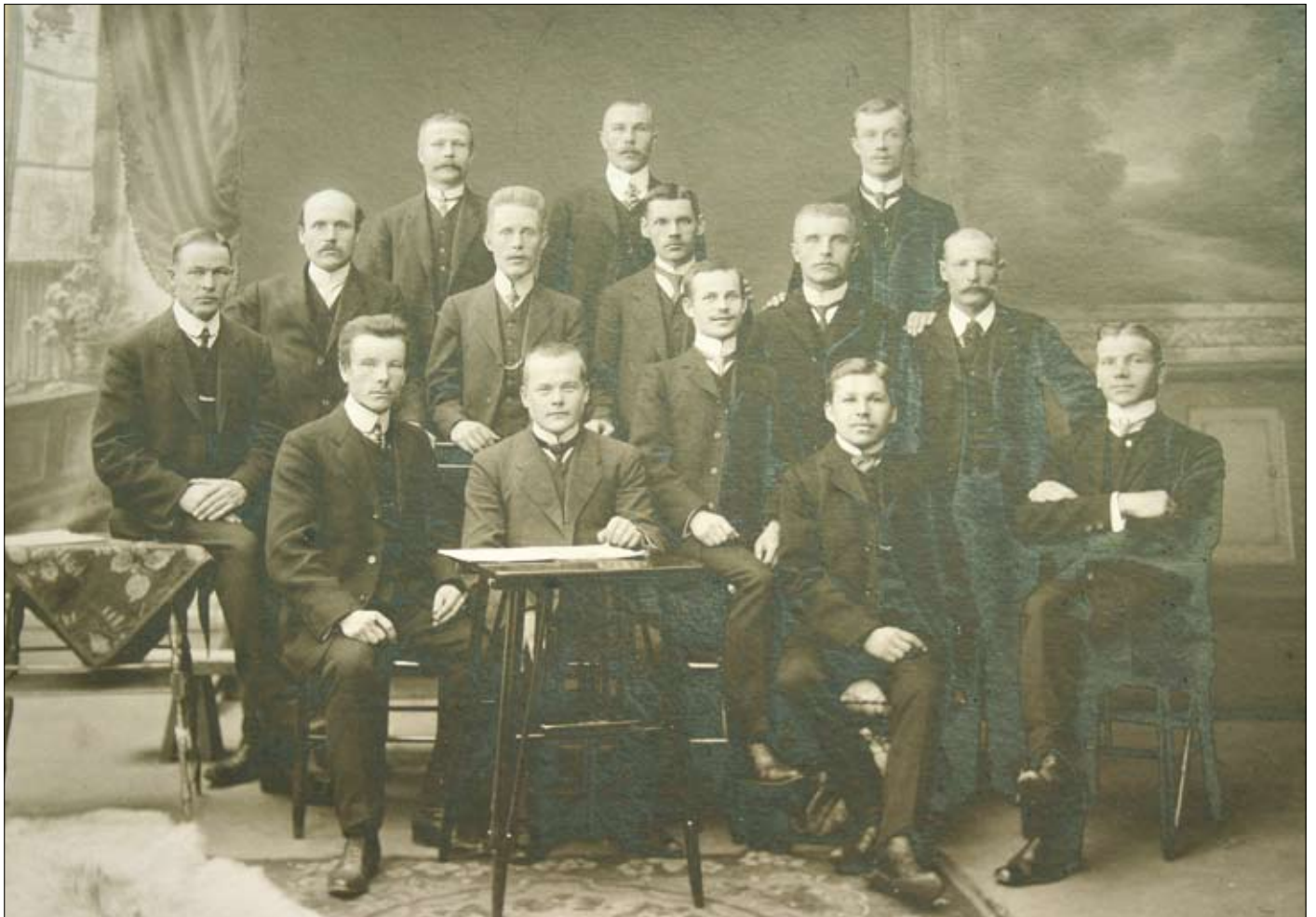
Helsingin Metallityöntekijäin yhteinen huvitoimikunta vuodelta 1910

Helsingin Metallityöväen ammattiosasto on aina ollut luonteeltaan useita työpaikkoja koova osasto. Siksi sen toiminnassa syntyneissä papereissa ei näy se työ, jota yksinäisillä työpaikoilla tehtiin työläisten välittömien olosuhteiden parantamiseksi. Työ, jota tekivät ammattiosastoon kuuluvat työhuonekunnat ja työpaikkojen luottamusmiehet. Vain tilanteiden kärjistyessä, niitä käsiteltiin ammattiosaston toimikunnassa ja osaston kokouksissa.