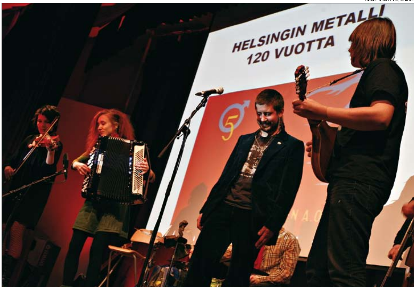
Mojakka yhtye esitti omiaan ja Hiski Salomaan lauluja raikkaasti ja innostuneesti. Juhlan yleisöstä useampi kävi kysymässä, mistä näin hyvä bändi löydetty, kun heidän musiikkiaan ei kuule radiossa tai televisiossa vaikka syytä olisi.