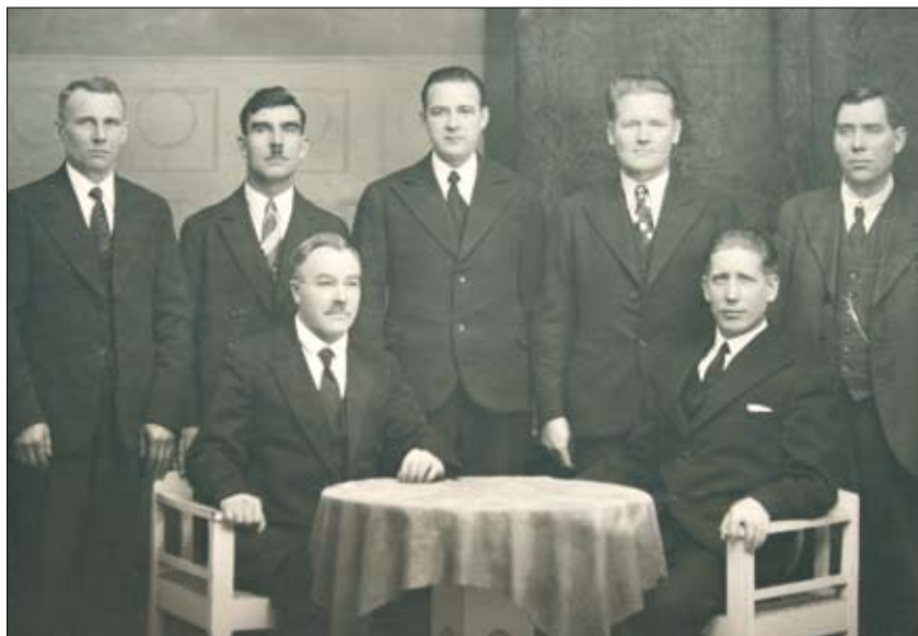
Helsingin Metallityöväen ao:n toimikunta v. 1936

Ennen sotavuosia koettiin vielä merkittävä, koko järjestökenttää ravistellut metallialan lakko. Crichton- Vulcanin konepaja Turussa ryhtyi lakkoon, johon osallistui n. 1600 työntekijää. Lakko aiheutti vakavia ristiriitoja silloisen SAK:n ja Metallityöväenliiton välillä. Ammattiosasto 5 tuki voimakkaasti Turkulaisia tovereita, Helsingin Mustikkamaalla järjestettiin ”taistelujuhla”, jonka rahallisesta tuotosta puolet lähetettiin Crichton- Vulcanin lakkoileville työntekijöille. Metalliliiton toimitsijat eivät taas puolestaan juurikaan hyväksyneet ammattiosasto 5 toimia, vaan pyrkivät estämään aktiiviset tukitoimet Turun lakon tukemiseksi. Huhtikuussa 1939 alkanut lakko loppui vasta elokuun lopulla.